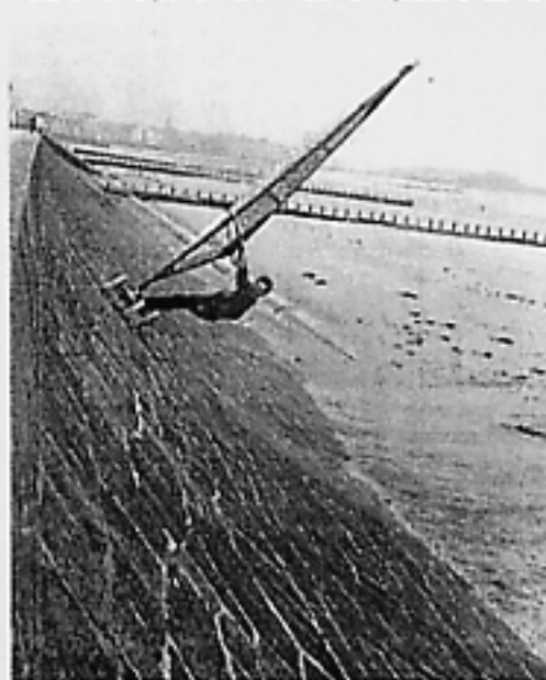
La passion de la glisse s'exerce sur toutes sortes de supports: par exemple en speed-sail sur la digue avec Fred Le Provost.

L'Émeraude Fun Cup est une série d'épreuves de funboard dont la première aura lieu ce dimanche devant le Sillon: inscriptions au Surf school de Saint-Malo, entre 10h et 11h30. Pour le milieu de la planche à voile, c'est le grand retour à la discipline du slalom, avec de la vitesse et des manœuvres entre des bouées mouillées le plus près possible de la plage. Les autres rendez-vous: le 9 avril à Lancieux; le 30 avril à Dinard; le 21 mai à Saint-Cast; le 10 septembre à Dinard; le 15 octobre à Lancieux; le 11 novembre, de nouveau à Saint-Malo. Contact: Yann Ael Collet, 02 99 46 83 86.