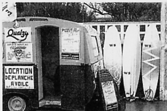
Du temps où le club mettait une caravane sur la digue...

Le club de voile a fait du chemin, depuis la rue de Courtoisville jusqu'à la Hogue. Il mêle avec bonheur convivialité et compétitivité.