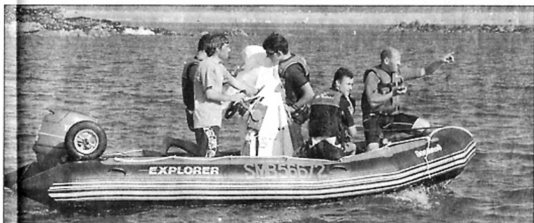
La chasse au trésor : toutes les compétences sont requises.

pour relever le défi. « Cap à l'Ouest vers le fort, c'est la solution ! », pourrez vous exiger. Sur les traces du corsaire Le Derc, la quête se fait autour des remparts de Saint-Malo et dans toute la rade. A chaque étape, l'histoire du lieu est contée. Riche, vivante