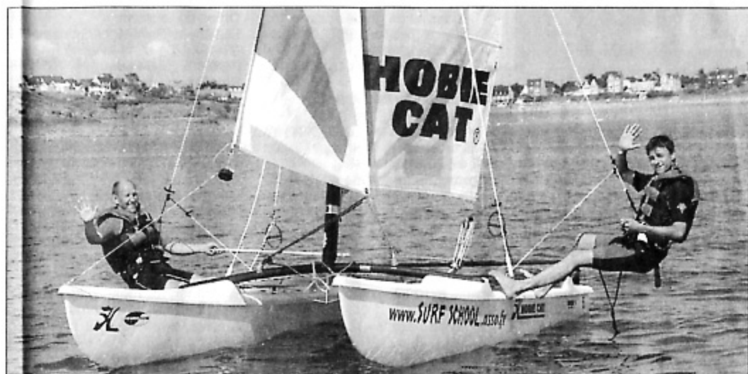
Les célèbres « Hobie cat 15 », un must de la voile légère.

Dans une embarcation rapide, une boussole et une énigme sont vos seules ressources. Les nouveaux marins (bientôt corsaires) devront tirer parti de leur connaissance de la baie